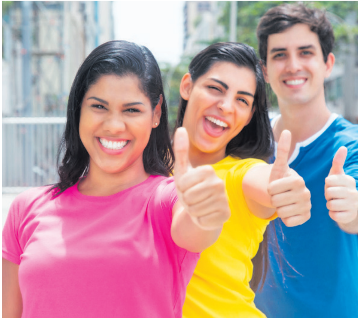
El feminismo aboga por la defensa de los derechos humanos y la libertad de todos: hombres y mujeres.

Por todo ello, querida persona neutral, afirmaciones del tipo “yo ni feminista, ni machista: yo persona neutral” pueden ser, como mínimo, algo confusas y poco útiles en una ciudad como la nuestra, en la que cada tres días una mujer o niña es asesinada. O un país como el nuestro, donde tres de cada cuatro víctimas de violencia sexual son niñas menores de edad, y donde cada hora entre cuatro y cinco niñas/mu-