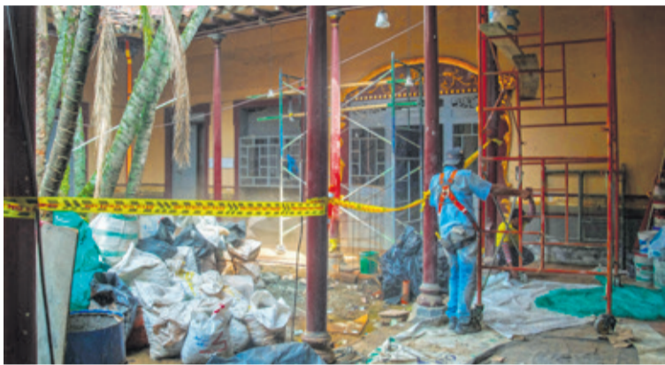
Se espera que toda la intervención esté finalizada la primera semana de abril.

El 17 de diciembre del 2018 comenzó oficialmente la restauración de la casa del Pequeño Teatro. Su principal objetivo es mejorar la infraestructura sin sepultar la historia del edificio.