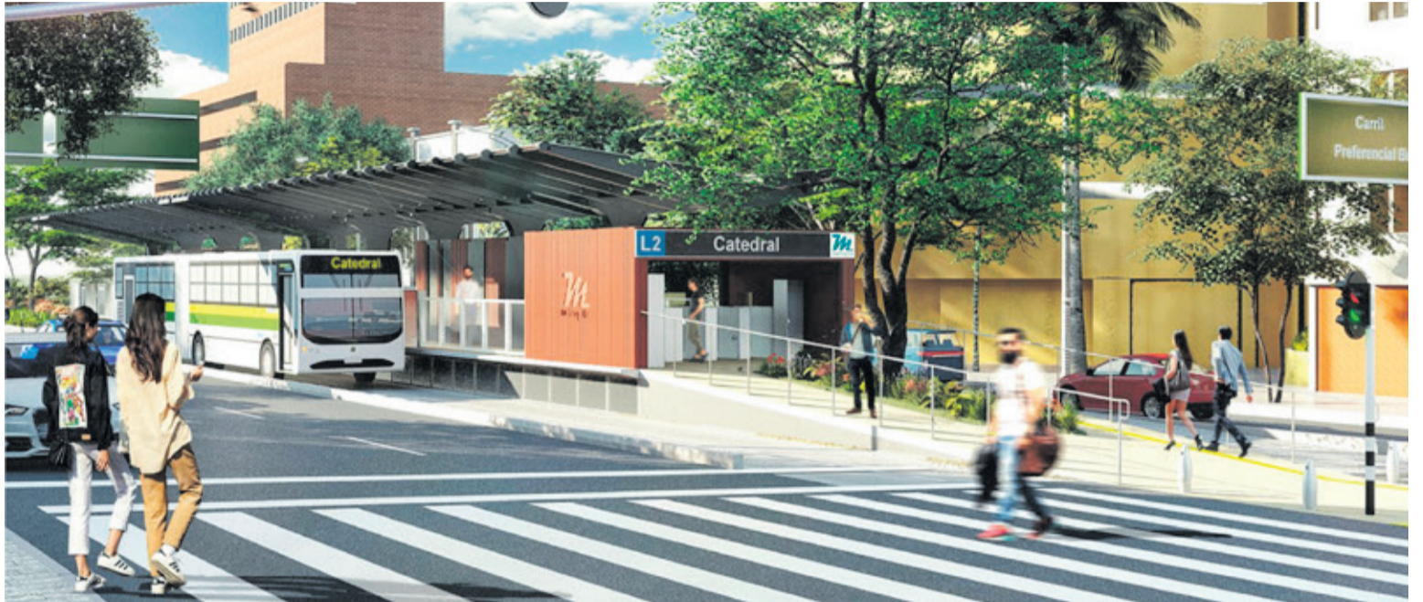
Así se proyecta provisionalmente la estación Catedral. Metroplús aclara que puede cambiar ligeramente su aspecto, debido a que los diseños están pendientes de ajustes.