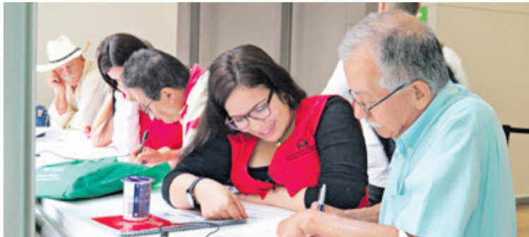
La sede centro de la Cámara de Comercio de Medellín para Antioquia continúa siendo la sede principal de la organización.