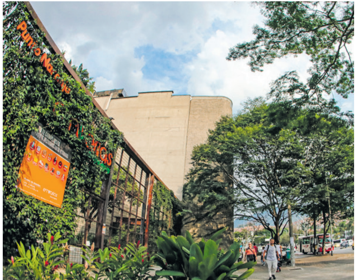
En abril del 2018, Emvarias grupo EPM, en alianza con el Grupo Retorna de la Asociación Nacional de Empresarios (ANDI), inauguró el primer Punto Naranja (Punto Limpio) fijo de Medellín.

Durante el 2018, el Punto Naranja reportó haber recogido 1,5 toneladas de material reciclable y 5,3 toneladas de residuos posconsumo. Esto es un total de 6,8 toneladas de residuos menos que dejan de acumularse en el Relleno de La Prade-