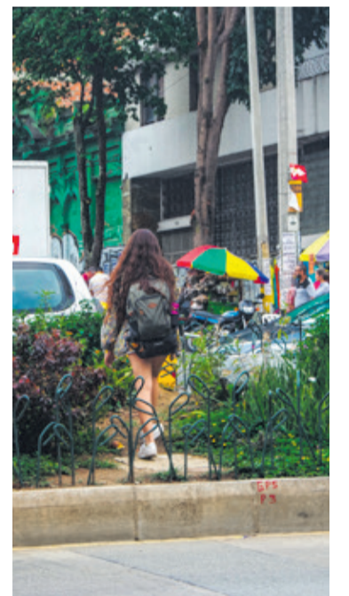
Malos comportamientos, como cruce por encima de las plantas, están afectando al Corredor Verde.

Sin embargo, hace una advertencia que indica, no puede ser tomada como negativa. “Creo que la densidad con que se sembró en el Corredor es excesiva y de esta manera en el futuro, habrá algunos árboles que no podrán convivir con esta cercanía entre un individuo y otro”. La parte positiva de esto explica el experto forestal, es que cuando estos árboles tengan un tamaño promedio, pueden ser trasplantados y de esta manera surtir otros lugares de la ciudad, convirtiendo al corredor en una especie de vivero urbano, claro está, de lograr superar las agresiones a las que son sometidas las preciadas plantas.