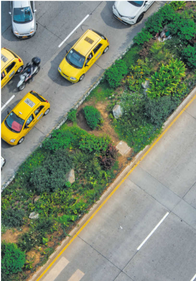
Así luce el Corredor verde de la avenida Oriental. La falta de cultura ciudadana ya ha dejado huellas.

Aunque la consolidación botánica y estética de la intervención es evidente, algunas personas afectan con basuras, malos comportamientos y escombros esta nueva cara bonita del sector.