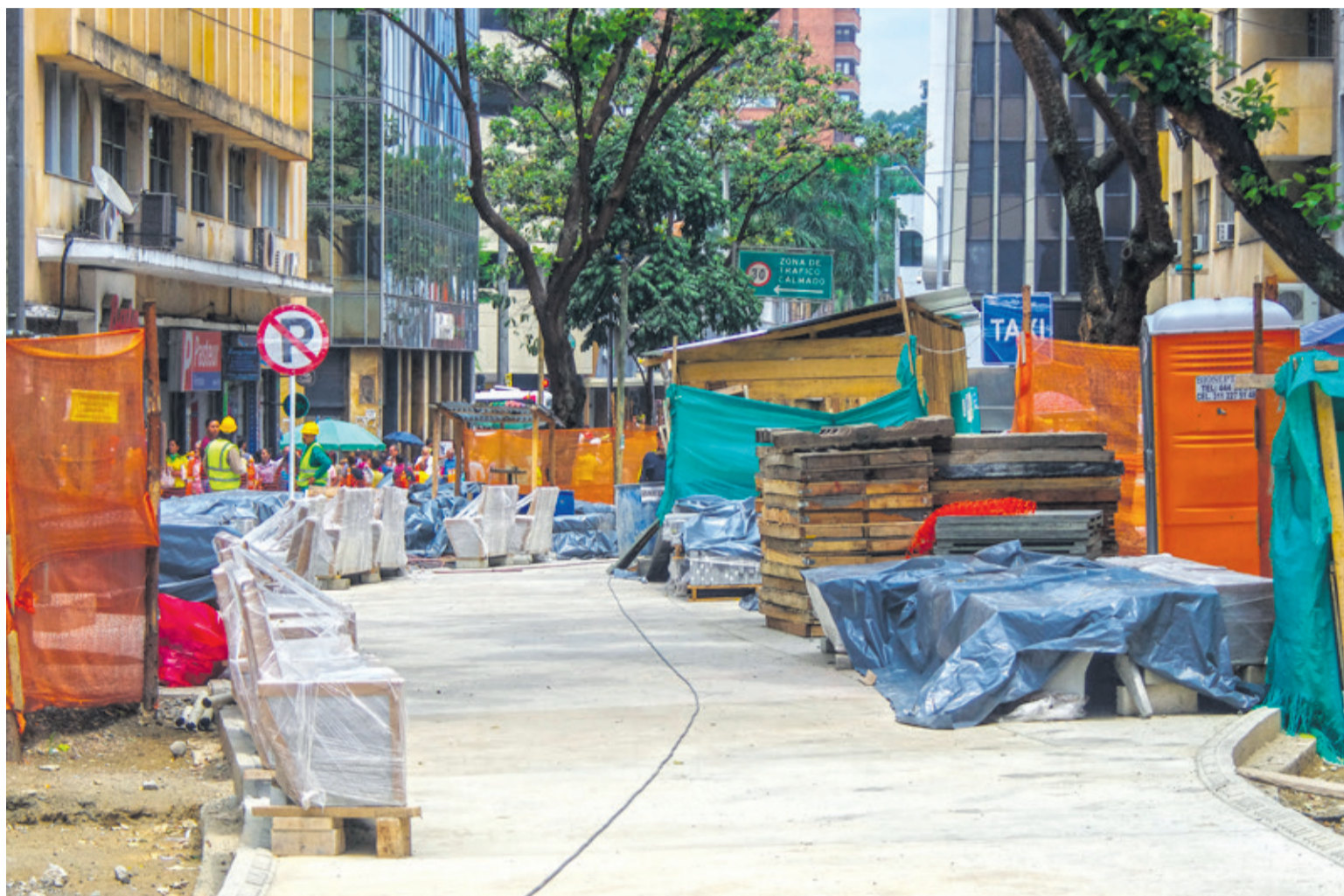
La renovación del espacio público en la carrera Junín, entre La Playa y Ayacucho, avanza según lo programado y estará listo terminando marzo

Siguen en ejecución 20 parques, pero otros dos están en fase de contratación (Bolívar entre ellos) y los restantes diez apenas están en diseño (como el esperado del an-