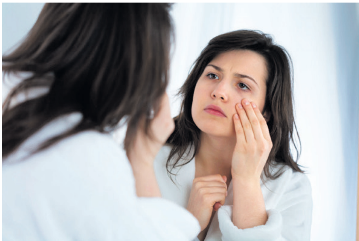
La piel es el órgano más grande de nuestro cuerpo, cuidarla más que vanidad es necesidad.

Construir rutinas no es siempre una tarea sencilla, pero en lo que al cuidado de su piel respecta, quizá sea el momento de ser un poco más estrictos. Tome nota.