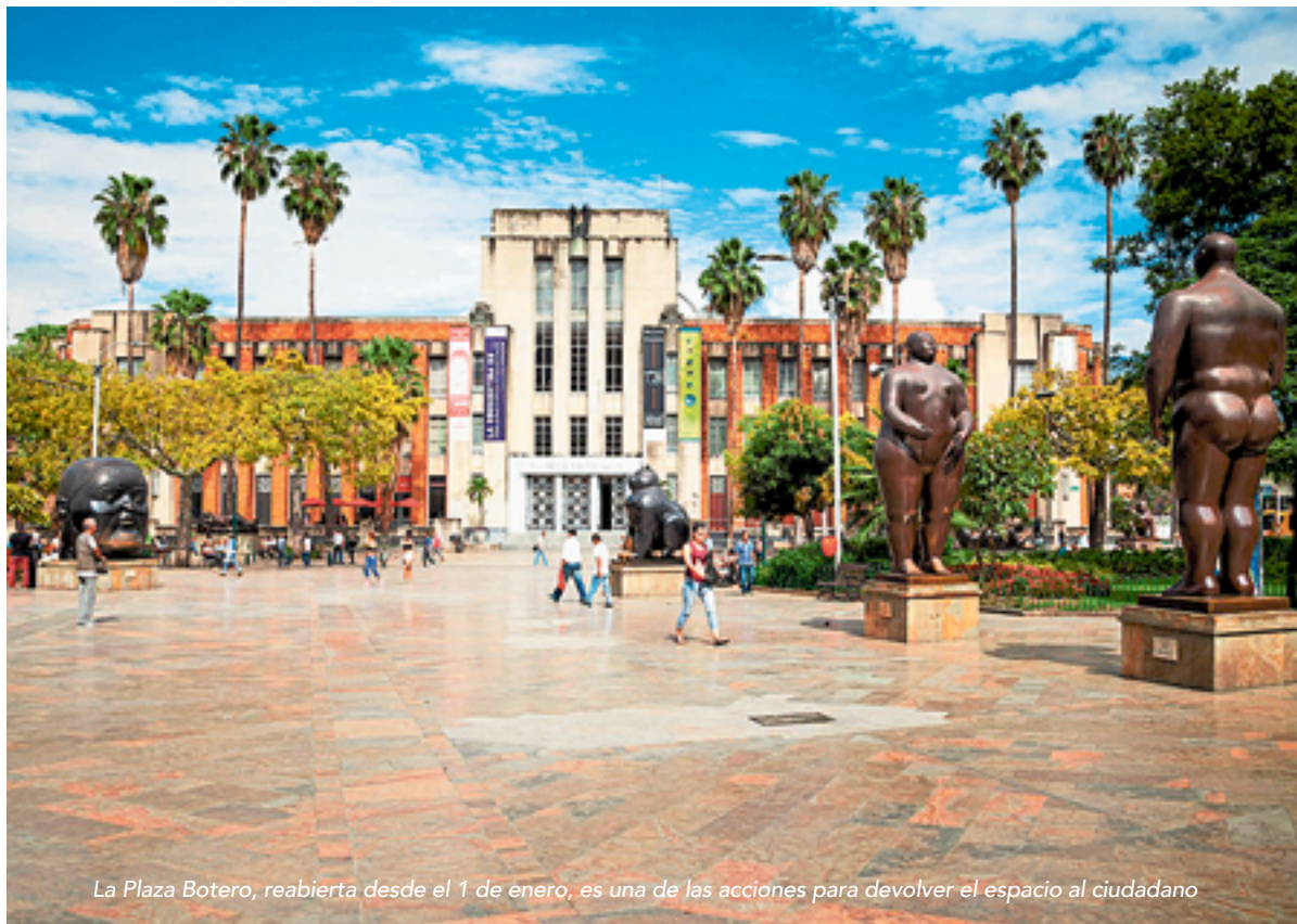
La Plaza Botero, reabierto desde el 1 de enero, es una de las acciones para devolver el espacio al ciudadano

Además de esto, durante los primeros meses de 2024 se ha observado una mayor presencia