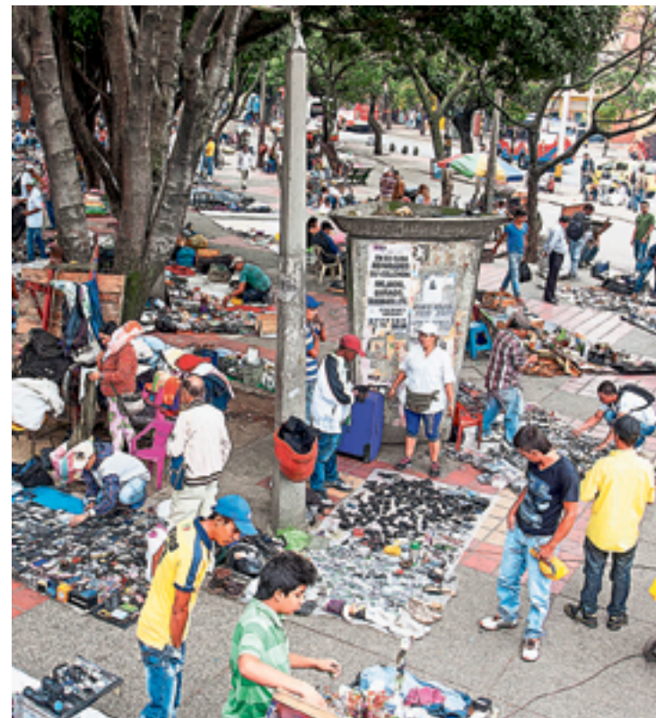
Controlar la invasión del espacio público es una de las tareas de la actual administración.

Un panorama que genera expectativa respecto a lo que vendrá en la administración de Federico Gutiérrez hasta 2026 y la necesidad de que el Plan de Desarrollo ponga a la Comuna 10 como prioridad, para de esta manera recuperar el terreno perdido en los últimos cuatro años.