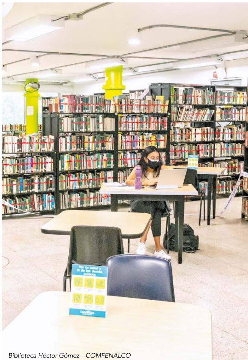
Biblioteca Héctor Gómez—COMFENALCO

De esta misma forma, bibliotecas como las de Comfama y EPM también trabajaron de forma constante durante los meses de cierre total para poder continuar brindando sus actividades al público y no pausar sus