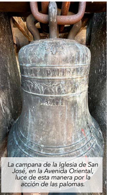
La campana de la Iglesia de San José, en la Avenida Oriental, luce de esta manera por la acción de las palomas.

Pese a esto, más allá de las acciones institucionales, está en nuestras manos dejar de alimentarnos por cuenta propia. Es una necesidad urgente si queremos proteger tanto la salud pública como la de las propias aves.