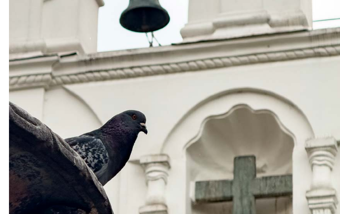
Muchos de los bienes patrimoniales del centro sufren en su infraestructura por la acción de las palomas.

Hoy están presentes en todos los continentes, a excepción