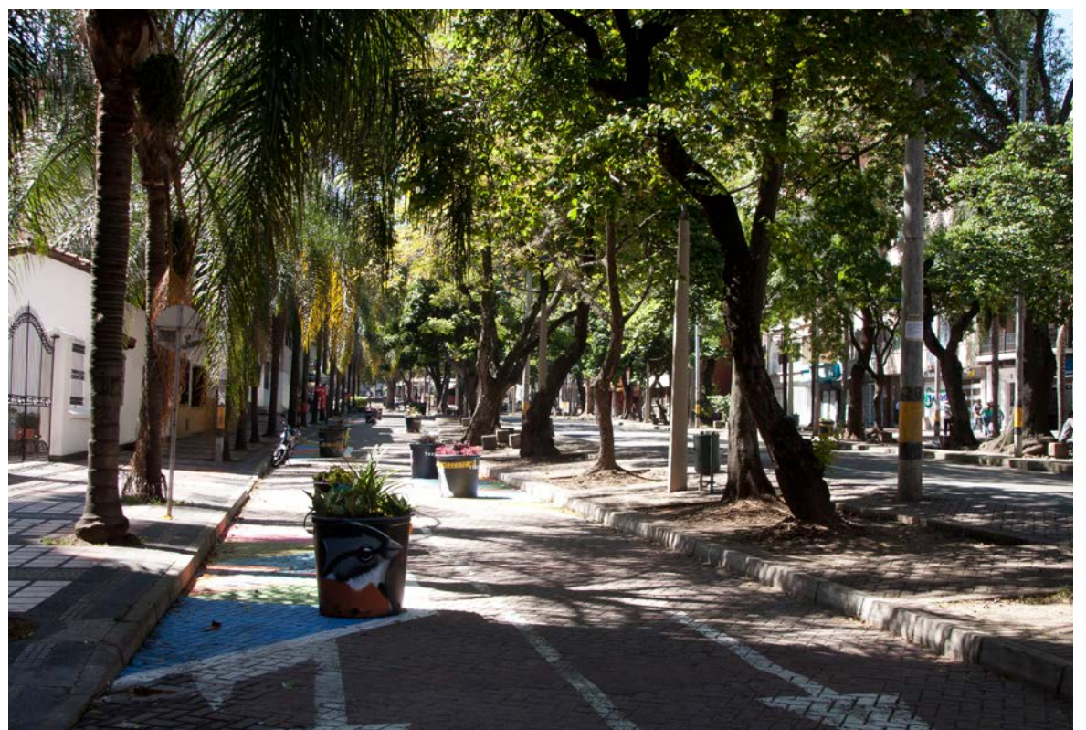
El urbanismo táctico en La Playa empezó a mediados de mayo. El primer tramo fue del Pablo Tobón a Girardot; el segundo va hasta la Oriental y se terminará este mes.