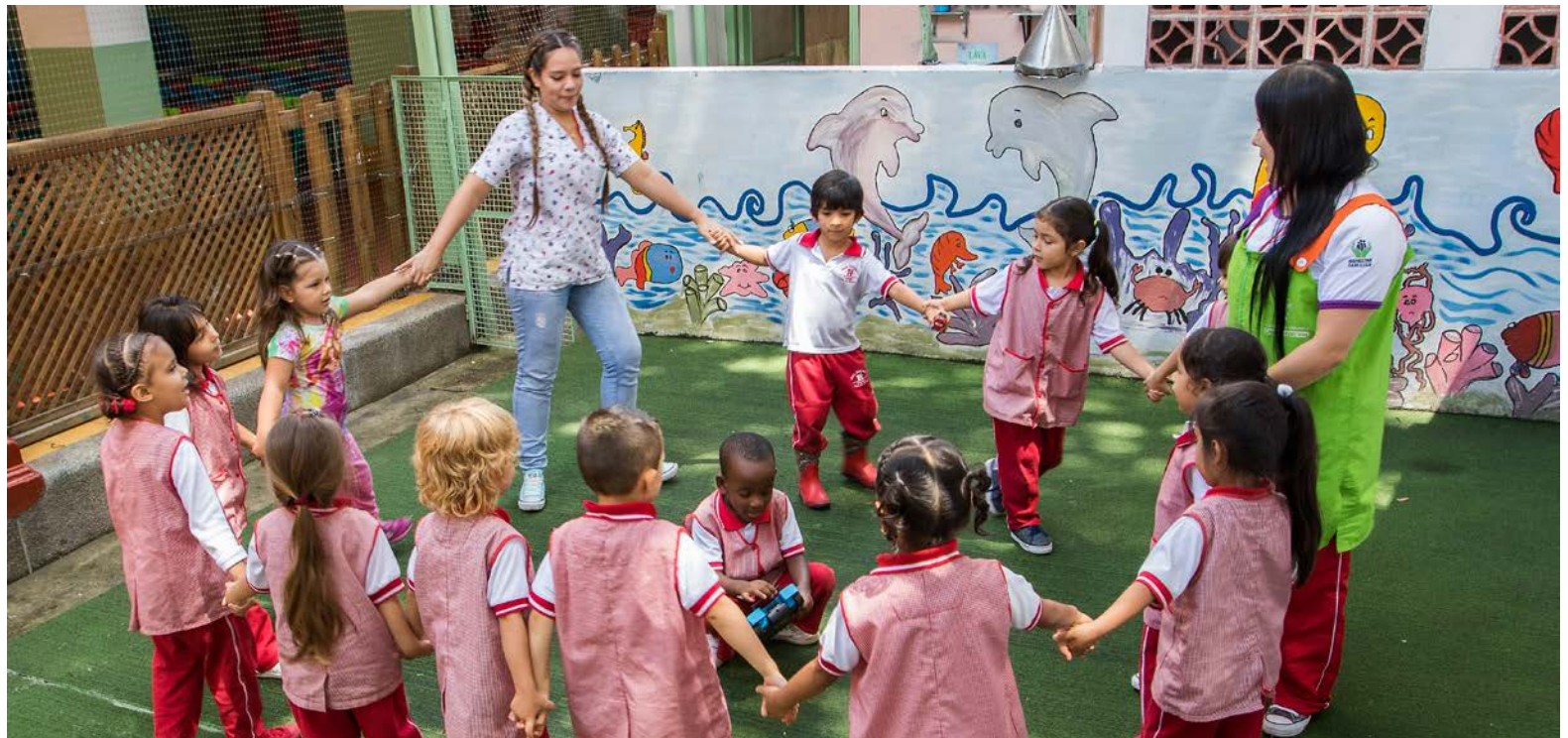
100 años, 30.000 alumnos y 4.000 metros cuadrados forman parte de la historia centenaria de esta guardería.

Y aunque en un primer momento buscó ayudarles regalándoles leche para los niños, en pocos días se dio cuenta de que su ayuda a la comunidad podía ser mayor. Entonces caminó unas cuadras hasta un salón del colegio San Ignacio -que le fue cedido- y allí fundó Gota de Leche, la primera guardería que tuvo la ciudad. Desde ese día se ocupó del cuidado de los niños.