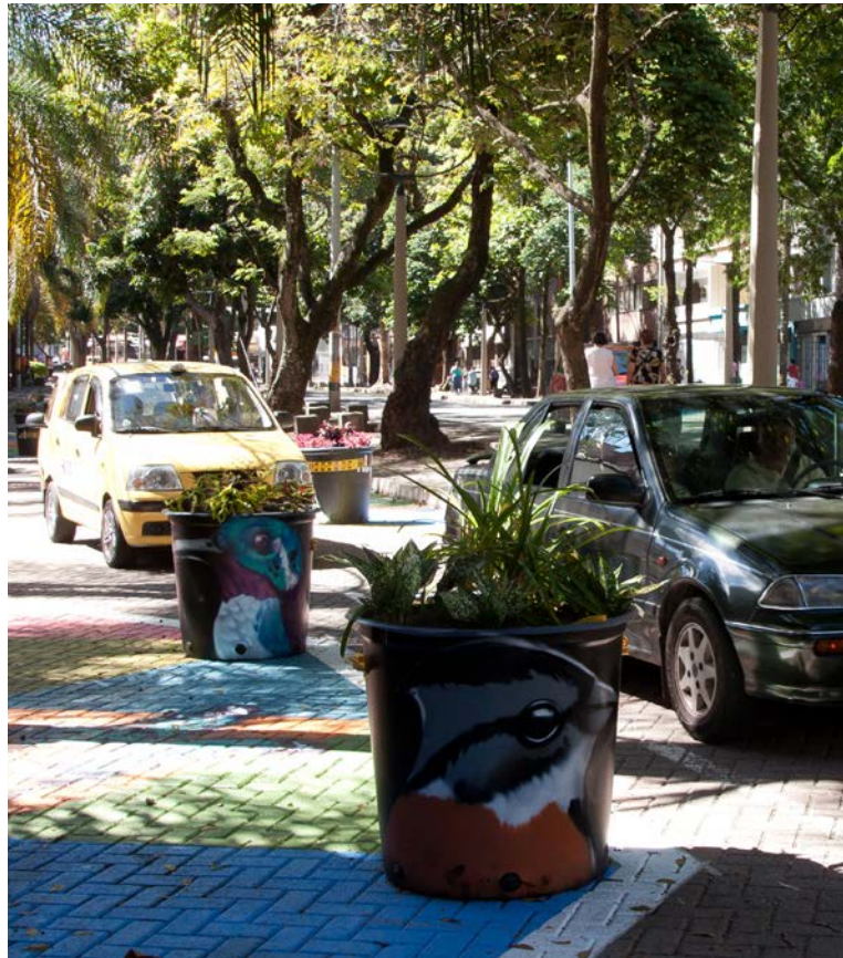
Las materas evitan que los vehículos transiten en línea recta, forzándolos a virar a derecha e izquierda, haciendo que disminuyan su velocidad.

Desde el teatro Pablo Tobón hasta la Avenida Oriental, en las calzadas laterales de La Playa, recientemente el piso adoquinado exhibe cada tanto unas pinturas de pájaros y otros animales silvestres muy bien logradas, acompañadas de grandes materas.