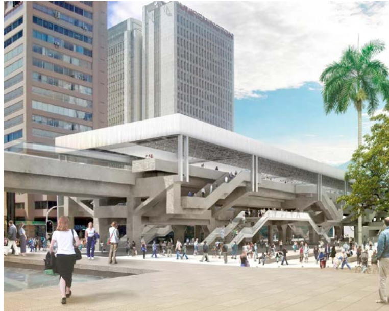
Esta sería la vista desde el Banco de la República al finalizar Paseo Bolívar.