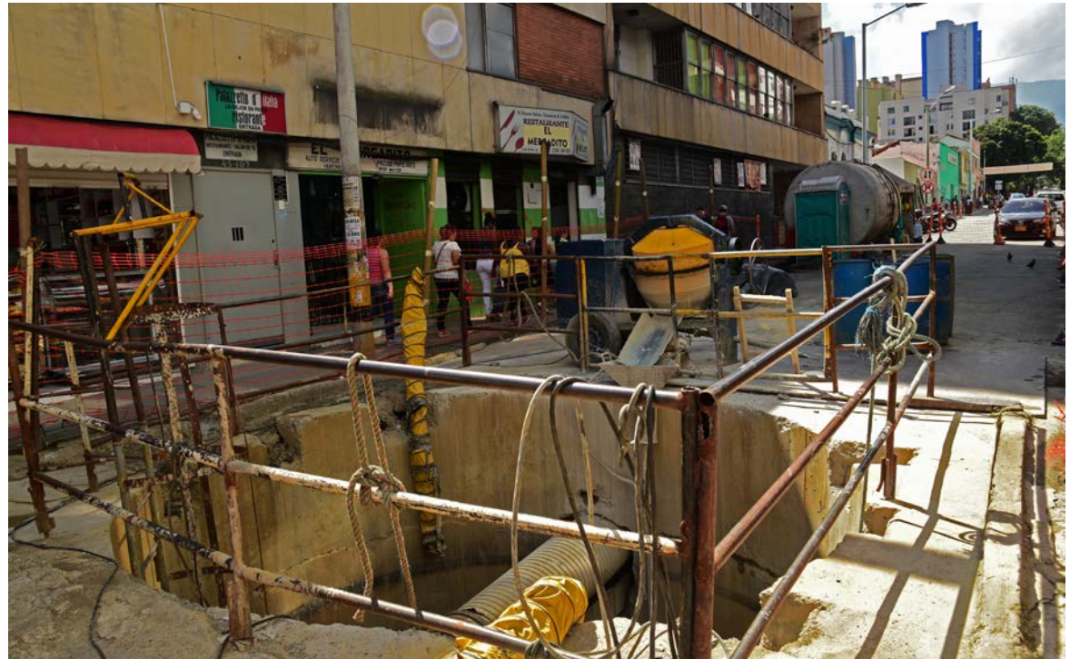
Seis meses completa cerrada la calle Caracas. Según EPM seguirá así por dos meses más.

“Tenemos cuatro contratistas trabajando simultáneamente en todo el centro y la