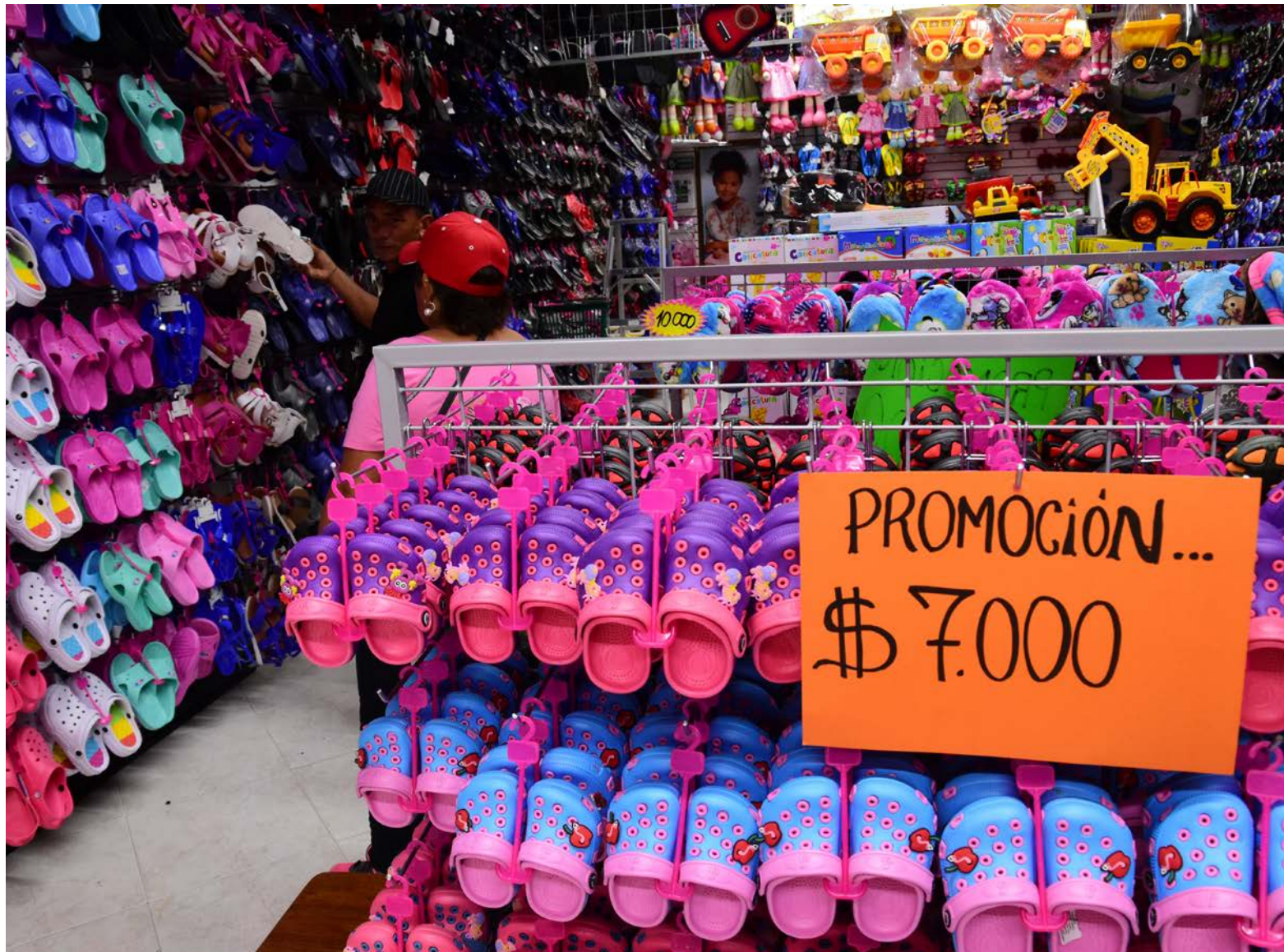
Las alzas en el IVA y las tasas de interés también afectaron la capacidad adquisitiva de los consumidores.

“Eso es competencia desleal, porque muchos informales venden productos falsificados y adulterados de pésima calidad, y los comerciantes formales no pueden competir pagando impuestos, prestaciones legales y seguridad. Es