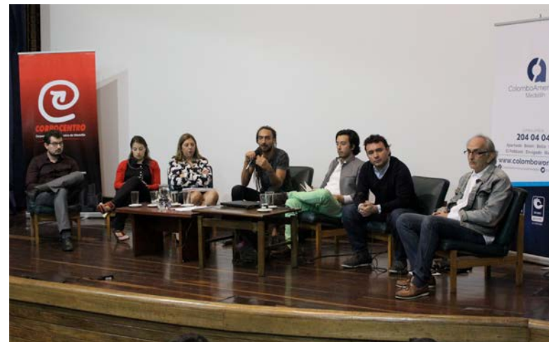
Cuatro foros más se realizarán este año. La invitación desde Corpocentro es a que la ciudadanía participe en este espacio de construcción colectiva.