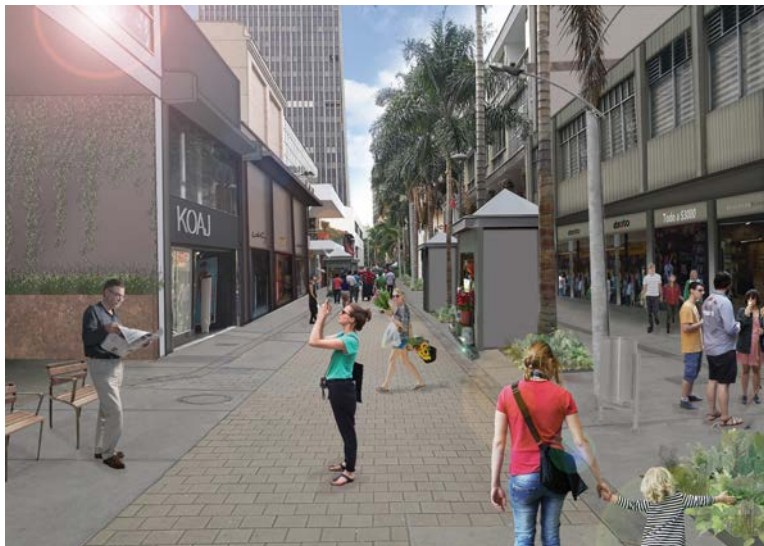
Se estima que así quedará Junín una vez finalice el proyecto.

Con el proyecto de renovación de Junín se pretende recuperar el paisaje urbano de este importante sector del centro tradicional de Medellín. Se calcula que la obra tendrá una duración aproximada de ocho meses a partir de agosto.