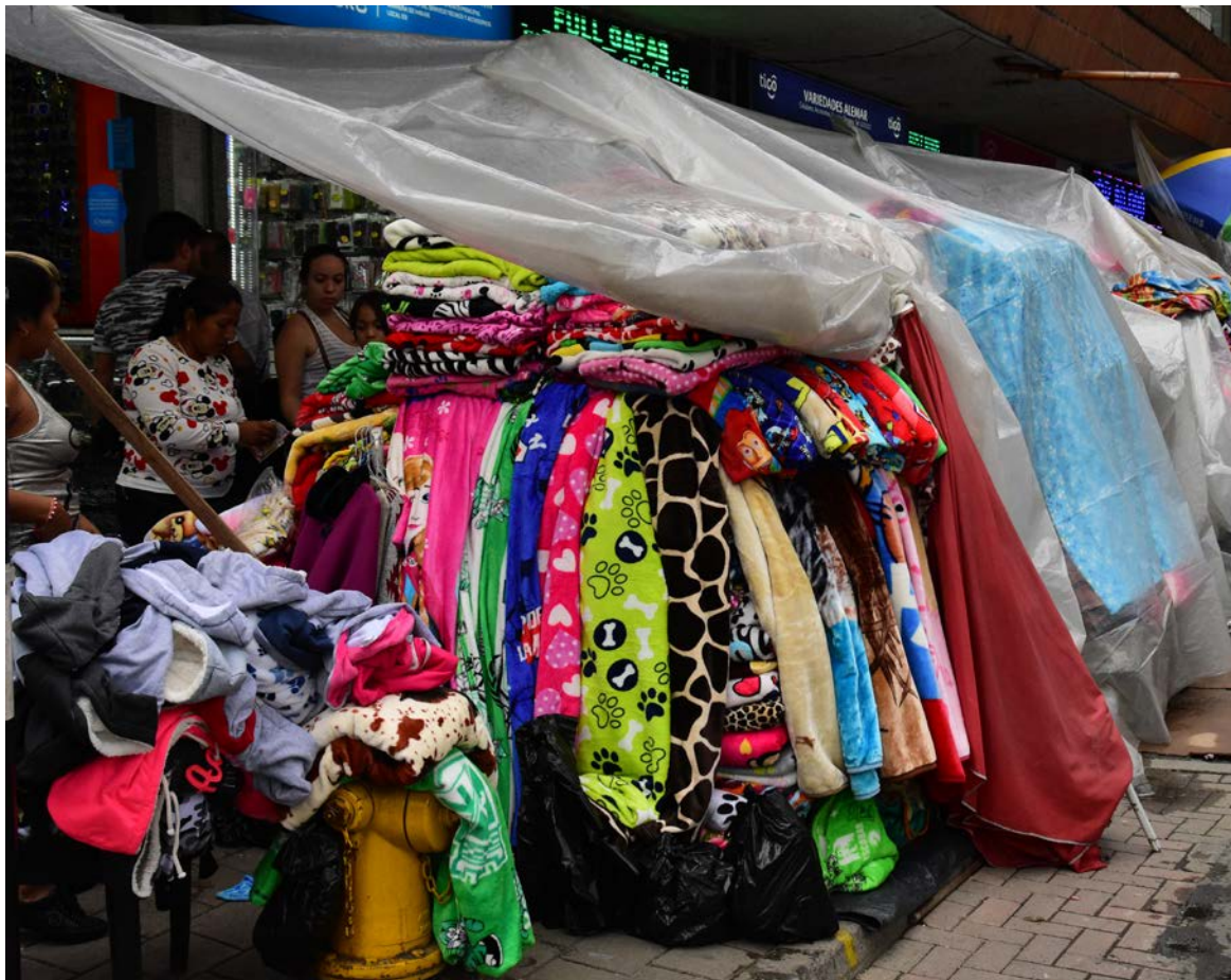
Las ventas ambulantes se dispararon en el centro.

Según cifras de Fedesarrollo, Medellín tiene el Índice de Confianza al Consumidor más bajo entre todas las ciudades capitales del país con -17,4 por ciento. Eso quiere decir que buena parte de los hogares encuestados en la capital de Antioquia no creen que su situación económica o la del país vayan a mejorar en los próximos 12 meses.