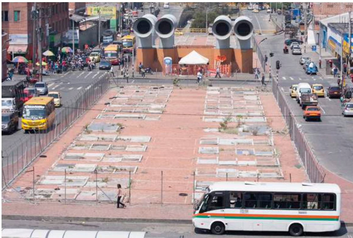
El lote en el que estaban construidas las plataformas A y B del bazar de los puentes continúa baldío.