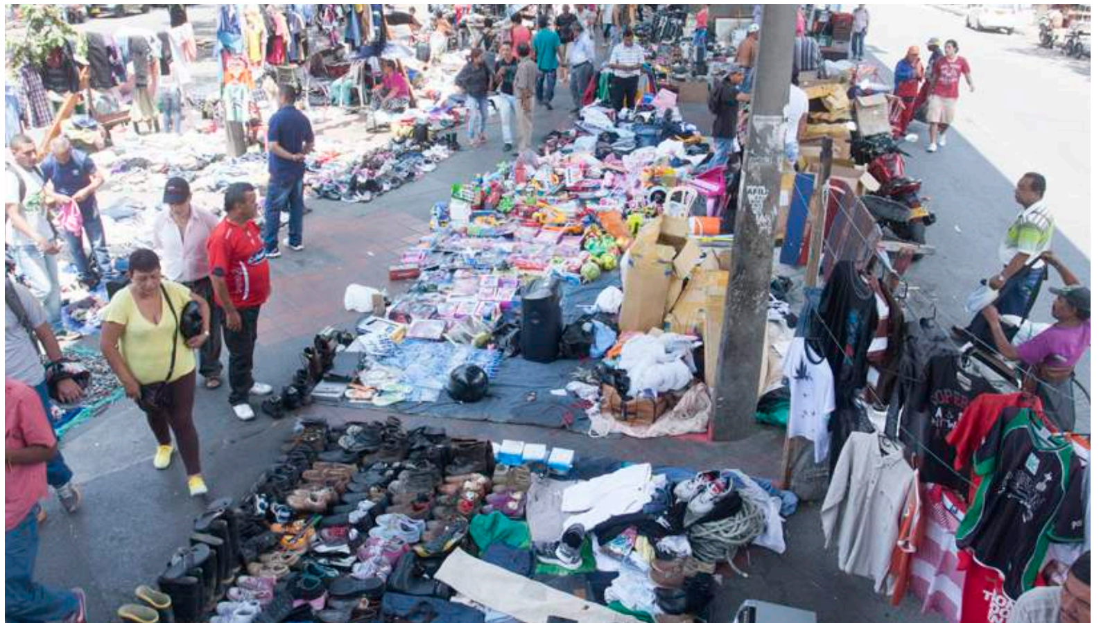
Los comerciantes desalojados se reubicaron cerca a la estación Prado del Metro. Denuncian que en los últimos días han llegado desalojados del Parque Berrío.