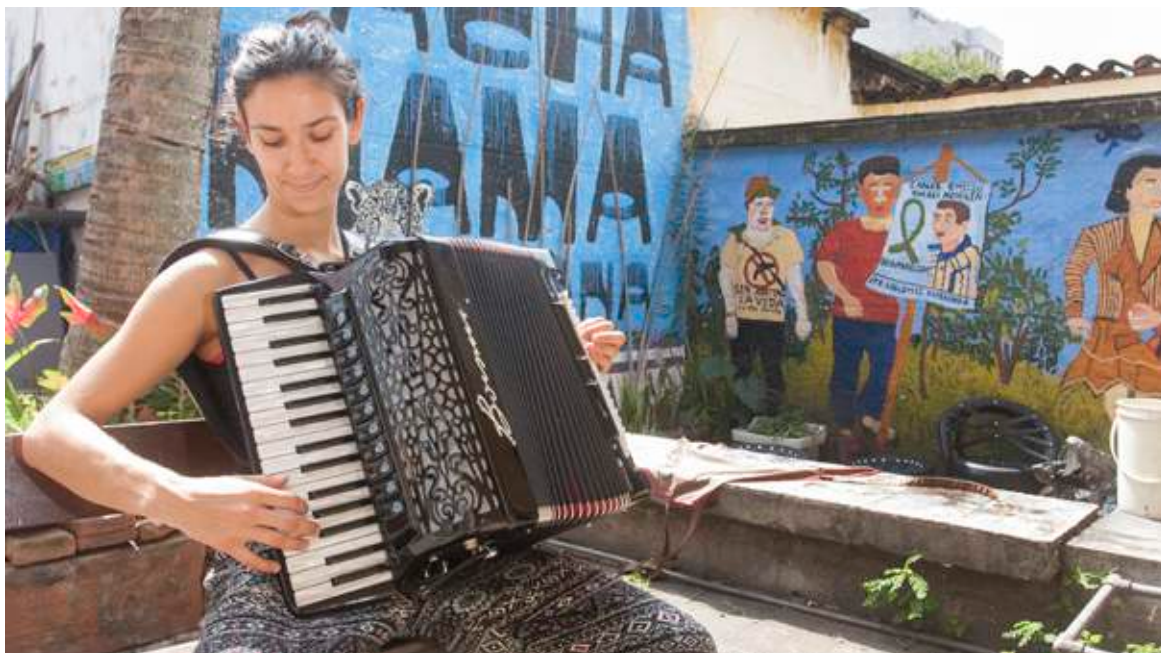
Prado, una mezcla entre lo clásico y lo moderno, necesita una política pública clara para cuidar todo su entorno.

A lo anterior se suma el tema de la especulación inmobiliaria: hoy nadie sabe cuál es el valor real de una casa en el barrio Prado, cada quien pone el valor que considere; unos salen “tumbados”, otros solo están esperando que pase el tiempo para lograr hacer una millonaria transacción inmobiliaria a costa de la desaparición del barrio como patrimonio, convirtiendo los bienes patrimoniales en simples lotes de engorde.