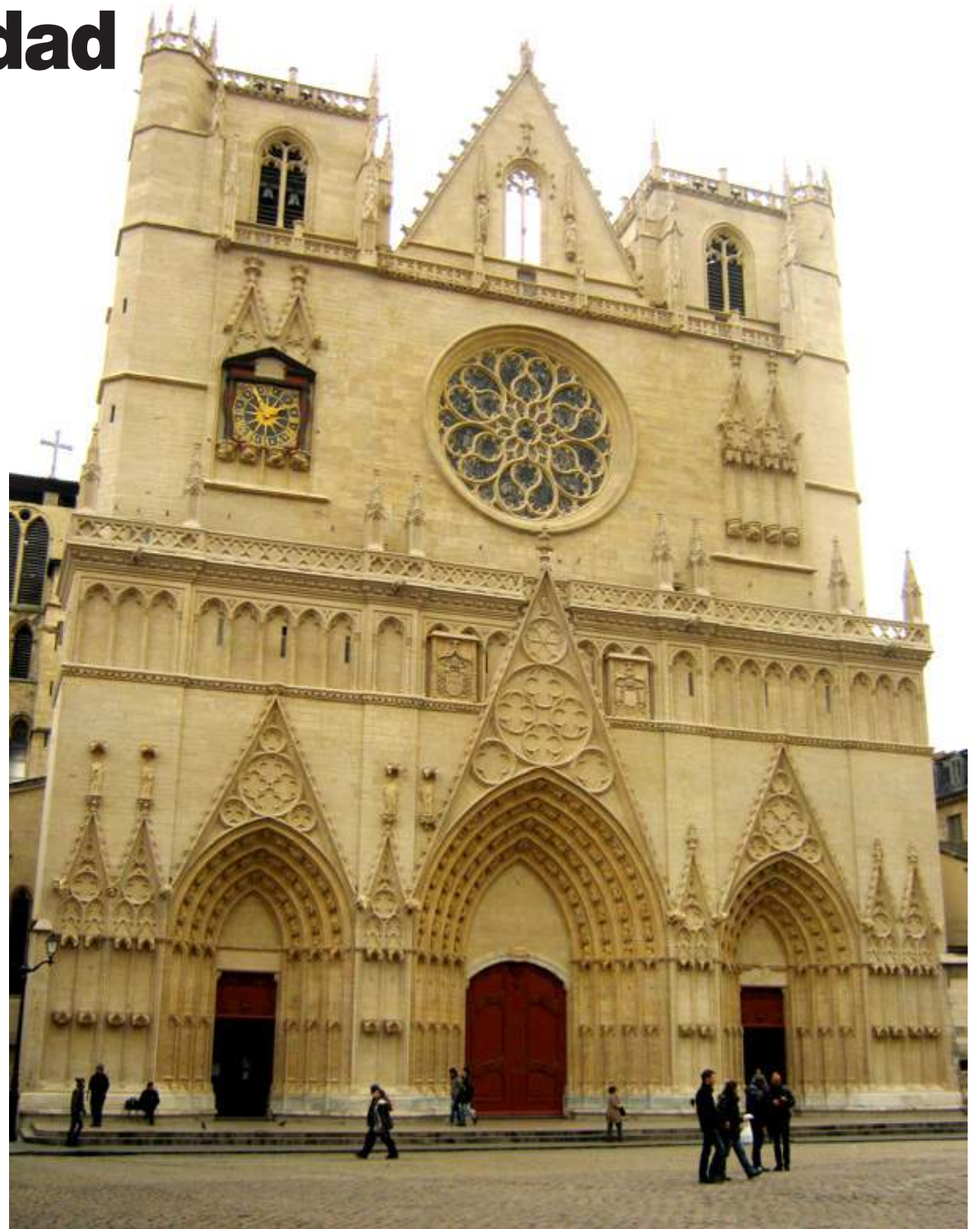
La arquitectura clásica del medioevo es uno de los tesoros que ofrece Lyon a todos sus visitantes.

Junto a Venecia es considerado uno de los barrios medieval y renacentista más grandes de Europa y que se mantiene casi intacto hasta nuestros días. Ubicado a orillas del río Saona y al pie de la colina de Fourvière comprende 30