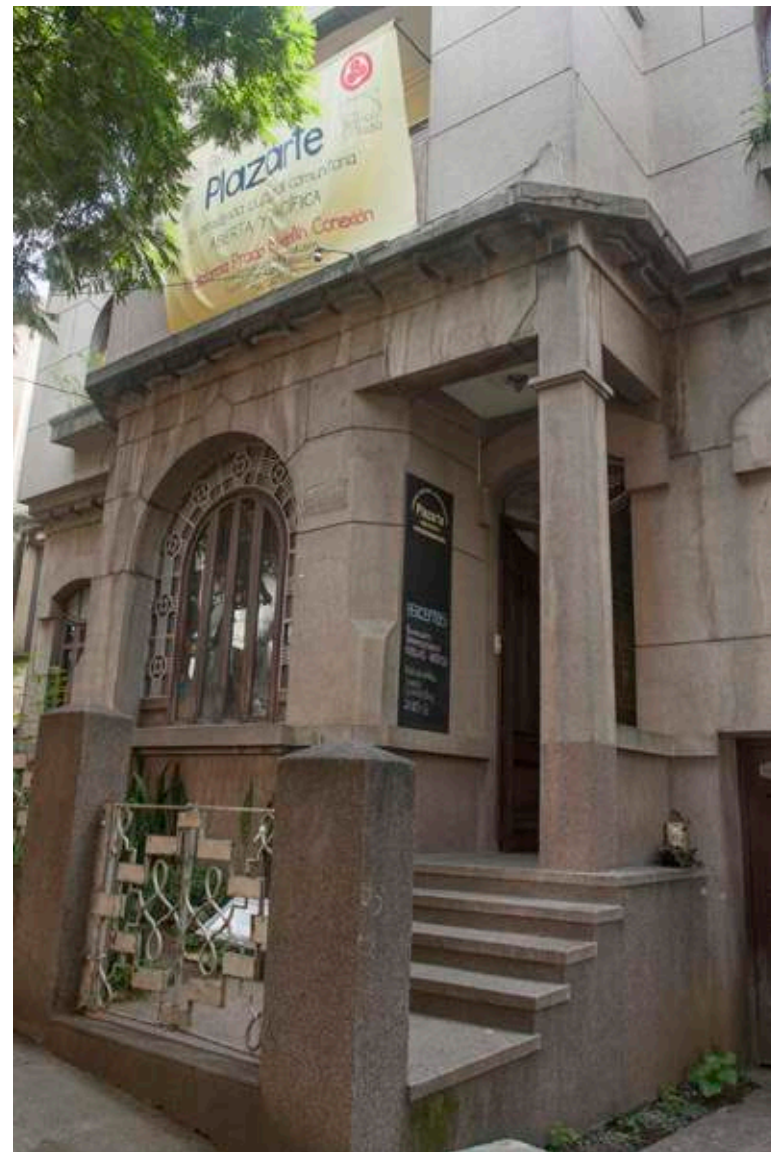
El barrio es patrimonio cultural que debe ser ajeno a disputas entre privados que deterioran las propiedades con fines comerciales.

Con la Ley 1185 de 2008 y su posterior decreto reglamentario 763 de 2009, el Ministerio de la Cultura diseñó los lineamientos para la formulación de los Planes Especiales de Manejo y Protección – PEMP-. Esta es la herramienta que en el país permite viabilizar técnica, jurídica, administrativa, social y económicamente la preservación de sectores y bienes inmuebles de interés cultural.