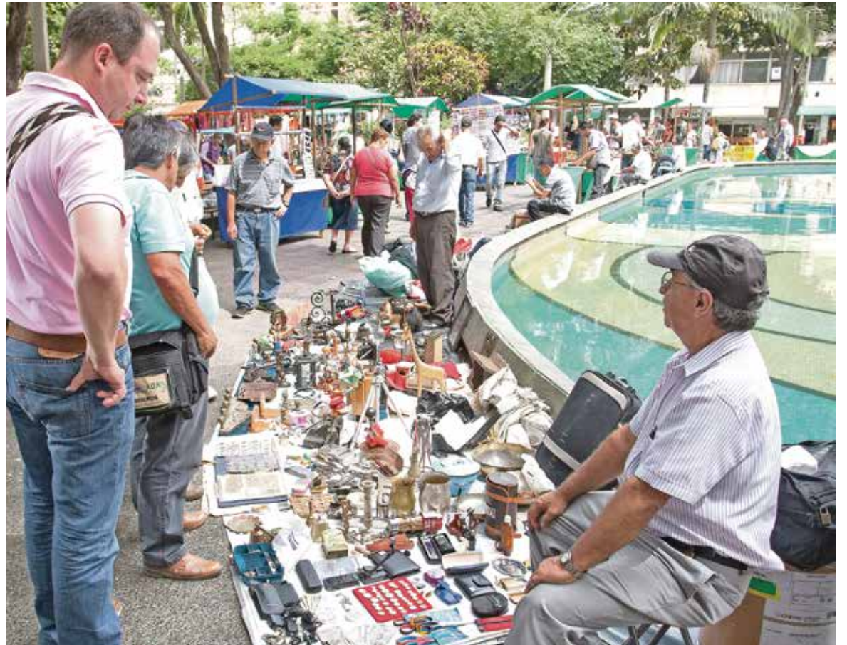
Aunque Sanalejo se realiza una vez al mes, en diciembre se realiza los tres primeros sábados del mes.

El artesano también llamó la atención sobre un cambio que percibió cuando Sanalejo empezó a ser administrado por la Subsecretaría de Espacio Público. “Antes era con Fomento y Turismo, de quien teníamos mucho apoyo, más publicidad, se escogían más las artesanías, nos valoraban más. De pronto