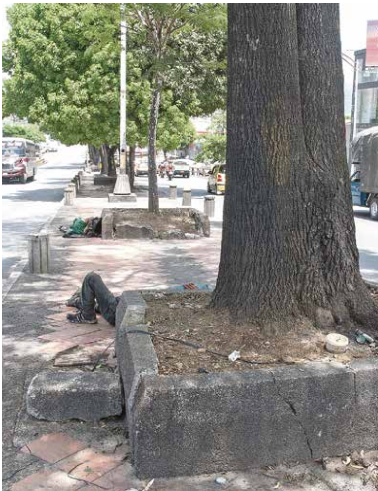
El estado actual de algunas jardineras.