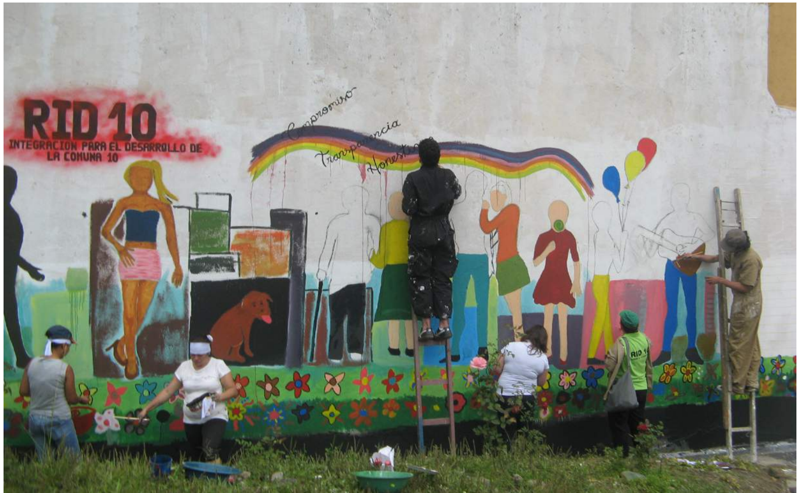
El trabajo de las 43 organizaciones de base comunitaria y social de la RID 10 se articula con los temas planteados en el Plan de Desarrollo Local.

Por medio de la Red de Integración para el Desarrollo de la Comuna 10 (RID 10) instituciones de este sector se capacitan para mejorar su impacto en la comunidad.