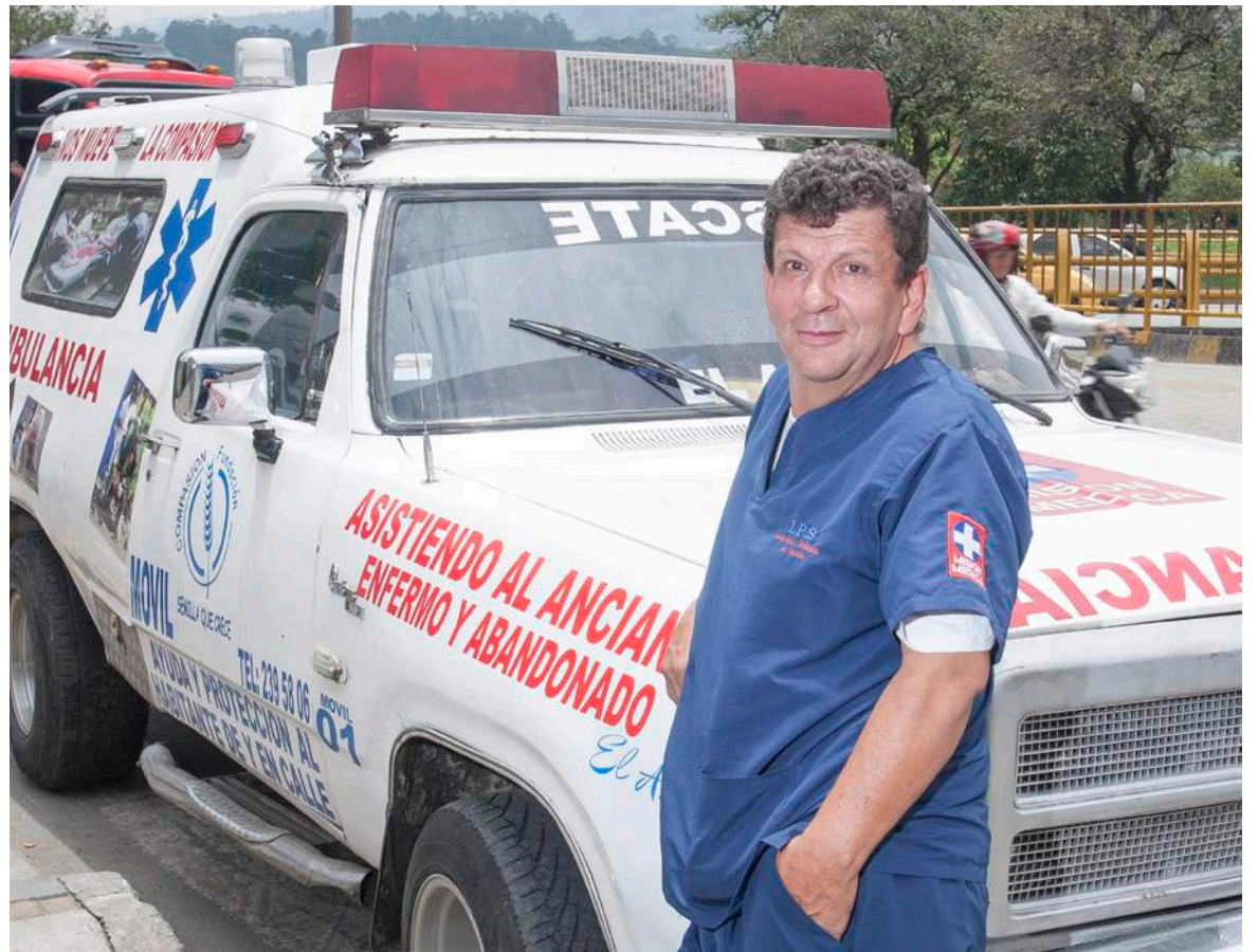
Falta pie de foto

“Aún no alcanzamos a subsidiar todo porque hay que comprar antibióticos, insumos y garantizar la bioseguridad. También necesitamos un conductor”,